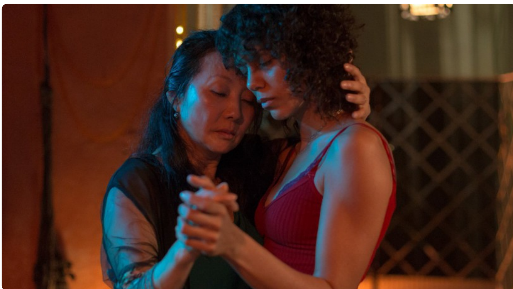
'Fortaleza Hotel', de Armando Praça, está na competição do 31º Cine Ceará

16:15 | Set. 30, 2021 Autor Clara Menezes Tipo Notícia